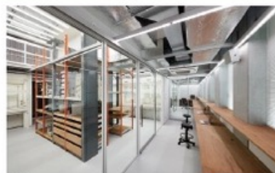
図1 研究者居室およびガラス扉で仕切られた化学実験室

「分子ライフイノベーション棟」が医学部附属病院敷地内に2016年度に本格的に稼働を開始しました。この建物は革新的なイノベーションの創出のための産学連携拠点整備を目的として、文部科学省「地域資源等を活用した産学連携による国際科学イノベーション拠点整備事業」の一貫として建設された東京大学の新たな研究拠点です。この建物の7階に機能性、安全衛生性を兼ね備えた先進的な化学実験室(図1)および有機デバイス実験研究室が完成しました。この研究室は建物の企画・設計段階から、現場研究者、大学事務、建築家、施工者が密接な連携を保って完成させた点で今後の大学研究室デザインと施工の方向性を示す好例と考えています。