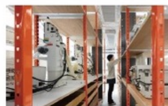
図3 可変棚や配線ラックを備えた機器ラックとメンテナンス通路

このようにしてクロスフィールド的視点から研究者と建築家が協力して設計を行い、大学事務および施工業者との協力のもと、国際レベルの快適・安全性を備えた実験研究空間が完成しました。