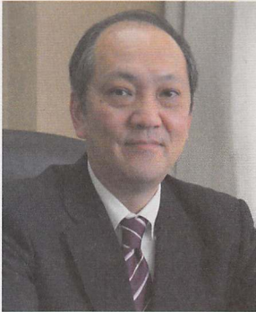
分子ライフイノベーション機構 機構長(医学部附属病院長)