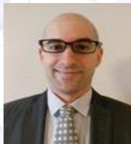
イリエシュ准教授 (17日のみ)