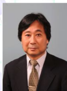
西原教授 無機分析化学系